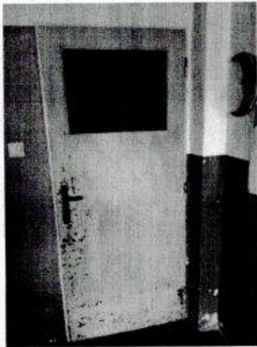
Ukážka Popis: Šatňa domácich