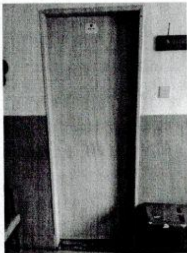
Ukážka Popis: Šatňa hostí