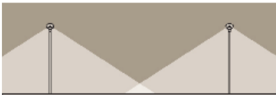
„VS“ verze - difuzor z plochého skla